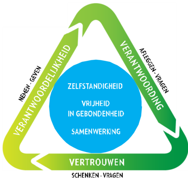
figuur 1. Daltondriehoek

Daarnaast heeft de Nederlandse Dalton Vereniging in 2012 landelijk vijf kernwaarden geformuleerd. Een vertaling naar de eigen school brengt ons tot drie eigenschappen die ons doen en laten typeren: betrokken, nieuwsgierig en veelzijdig.